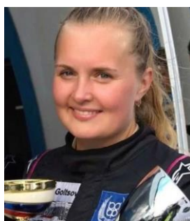
Офицер по связи с участниками